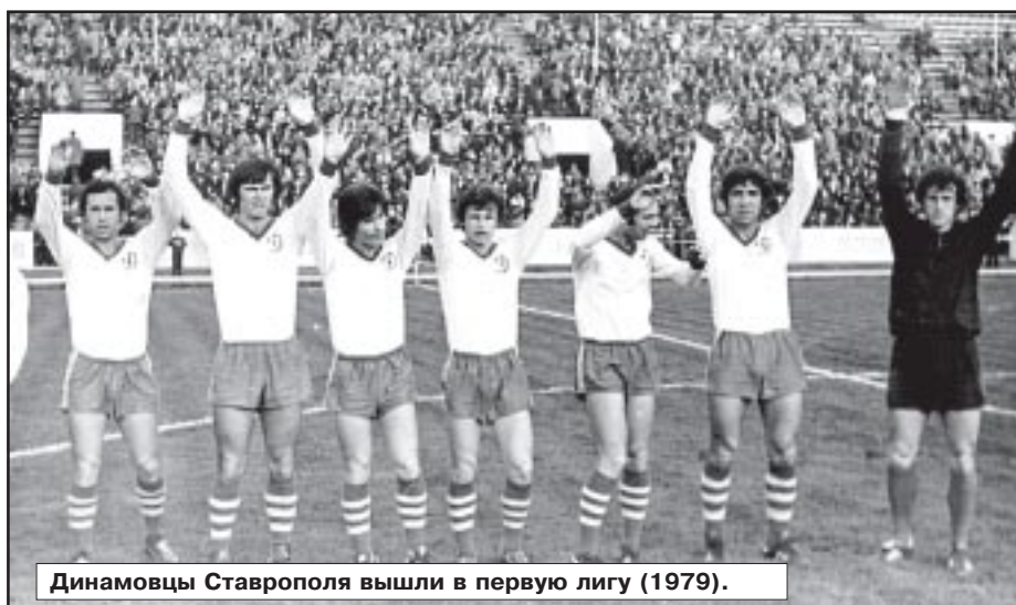
Динамо́вцы Ста́врополя вышли в первую лигу (1979).