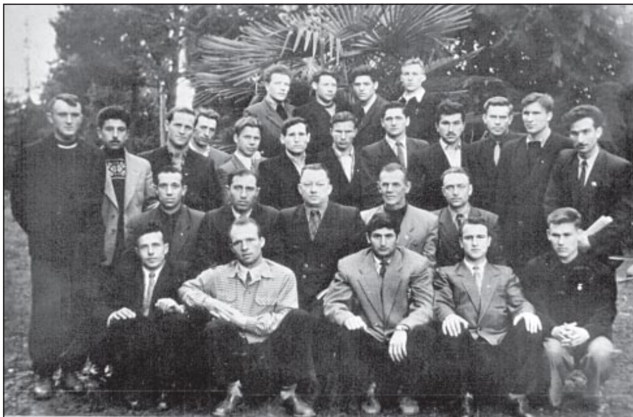
«Трудовые резервы» Ставрополь (1957).