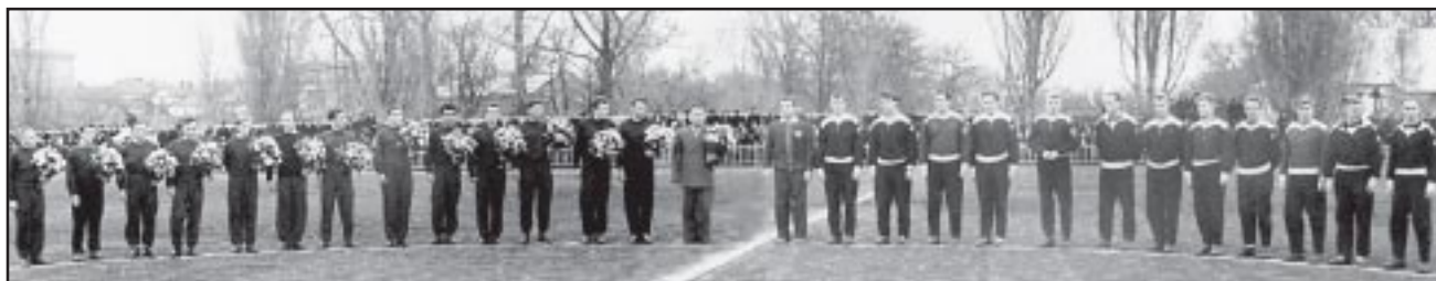
«Спартак» Ставрополь – команда г. Турку (1957).