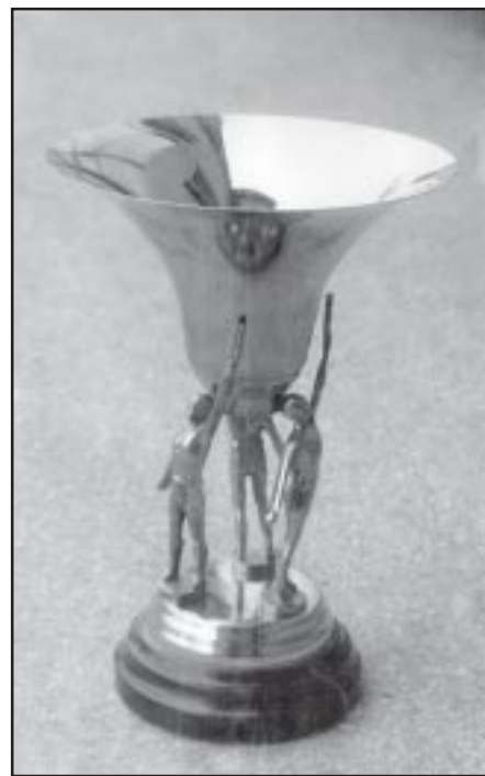
Этот кубок «Мотор» привез из Польши.